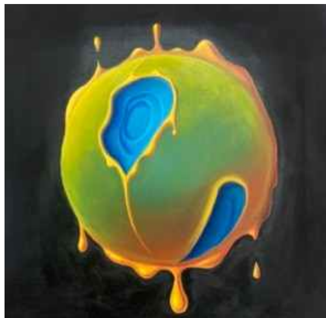
Lluna de mèl