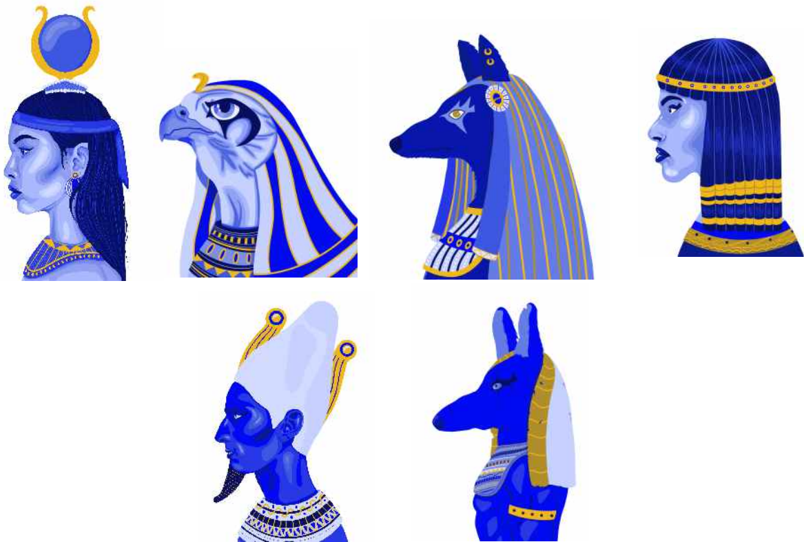
La mort d'Osiris: Anubis, Horus, Isis, Neftis, Osiris i Seth