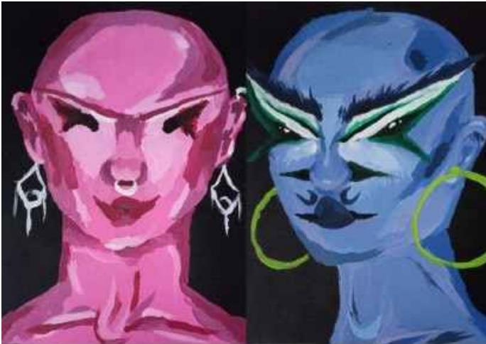
Monarca Bola de billar