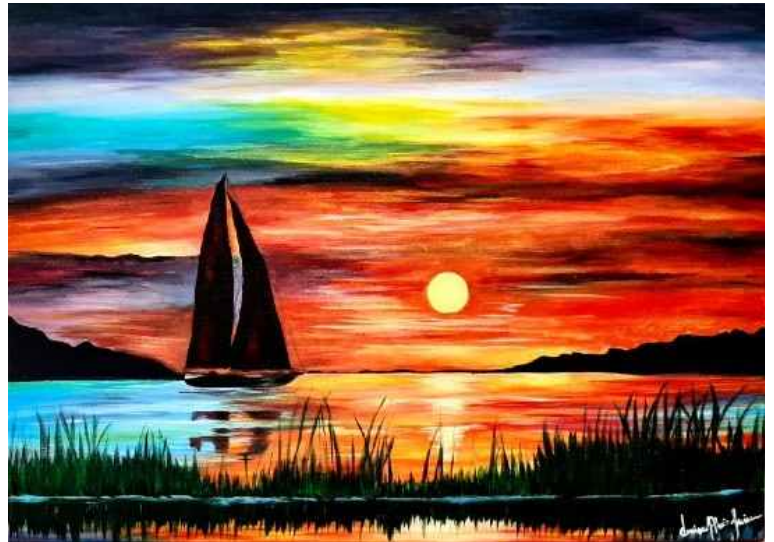
Capvespre a l'Albufera de València