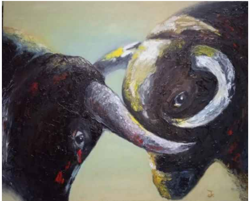
Baralla de bous