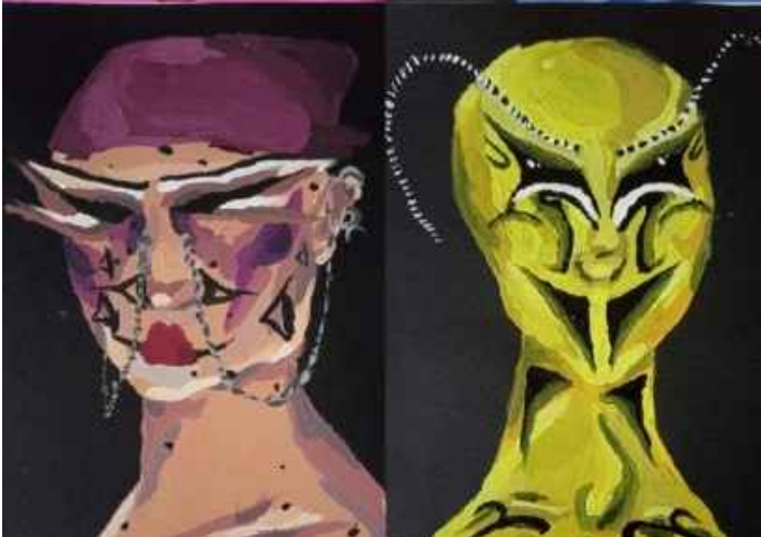
Pirata i Reina abella