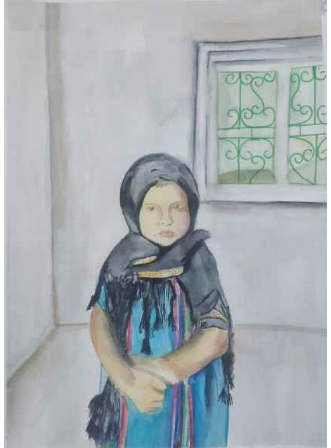
Massa calor en agost